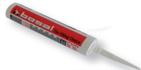
Bosal № = 258-021

258-501: 570 гр (x2) 258-502: 190 гр (x5) 258-504: 60 гр (x10)